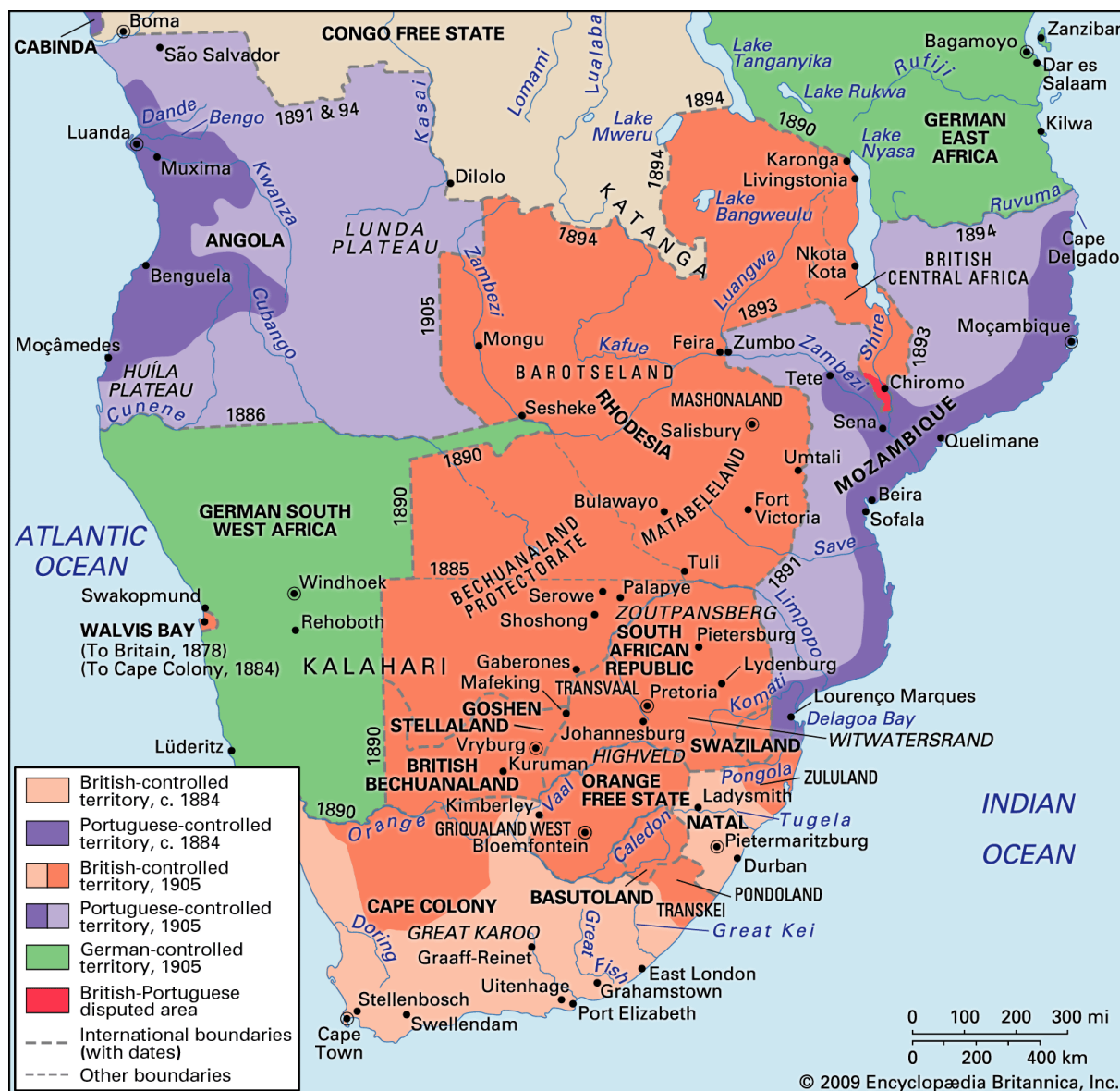
FIGUR 1 EUROPEISK KOLONISERING I DET SØRLIGE AFRIKA, 1884-1905.