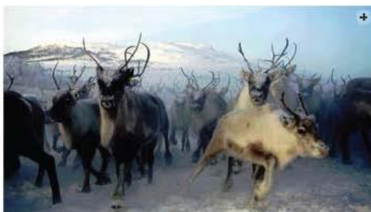
Reinflokken til Riast-Hylling reinbeitedistrikt