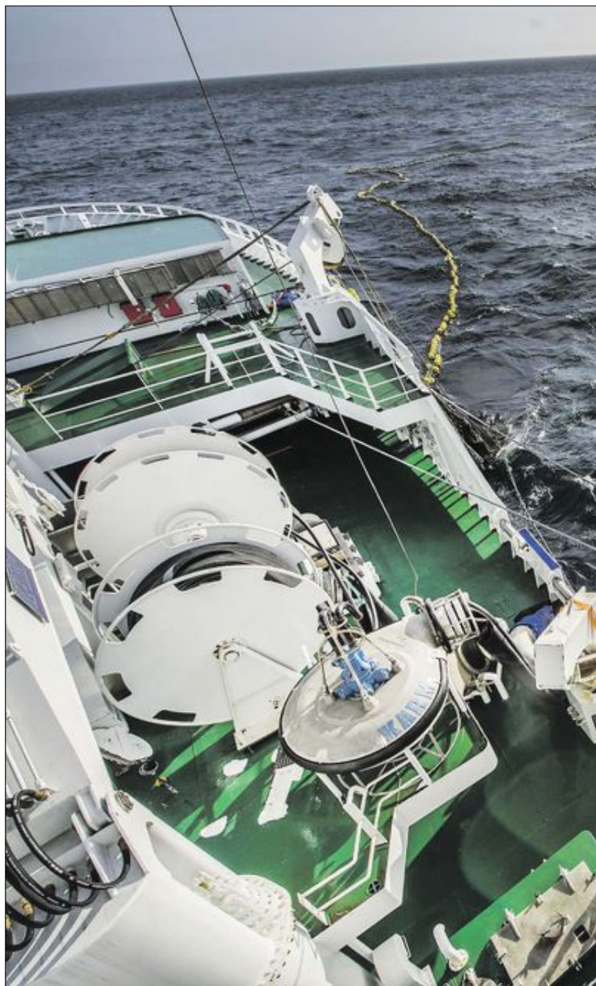
HAVET: Kronikkforfatteren har merket seg at politikerne gjennom sine strategier gjenstår å få jobben gjort. Her fra makrellfiske om bord i ringnottråleren «Fiske»

Rolls-Royce Marine er langt framme når det gjelder å videreutvikle og ta i bruk ny teknologi. De søker nå etter gode samarbeidsprosjekter verden over for å utvikle teknologi, kompetanse og arbeidsplasser i jakten på nye maritime tjenester og produkter.